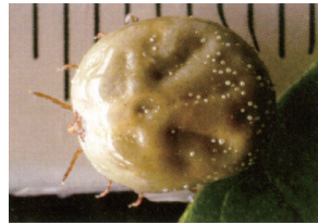
マダニ (吸血後:1cm程度)